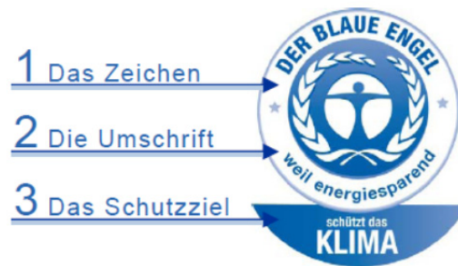
Abbildung 15: Logo des Umweltzeichens „Der Blaue Engel“

Arbeits- und Gesundheitsschutz sowie an die Gebrauchstauglichkeit erfüllen (Bundesministerium für Umwelt, Naturschutz und Reaktorsicherheit 2010). Zusammen mit Experten der einzelnen Bereiche entwickelte das Umweltbundesamt technische Kriterien zur Vergabe des Blauen Engels für Arbeitsplatzcomputer, tragbare Computer, Tastaturen, elektronische Vorschaltgeräte für Leuchtstofflampen, Mobiltelefone, Drucker, Beamer, Schnurlostelefone, Steckdosenleisten, Netbooks, Espresso- und Kaffeemaschinen, Voice Over IP-Telefone, Lampen, E-Book Reader, Router und Rechenzentren.